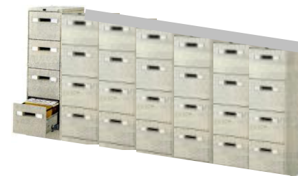
年度/月ごとの箱番号で管理

➡ 目的の文書を探したすのに 約5~10分 、 場合によっては30分以上かかっていた。